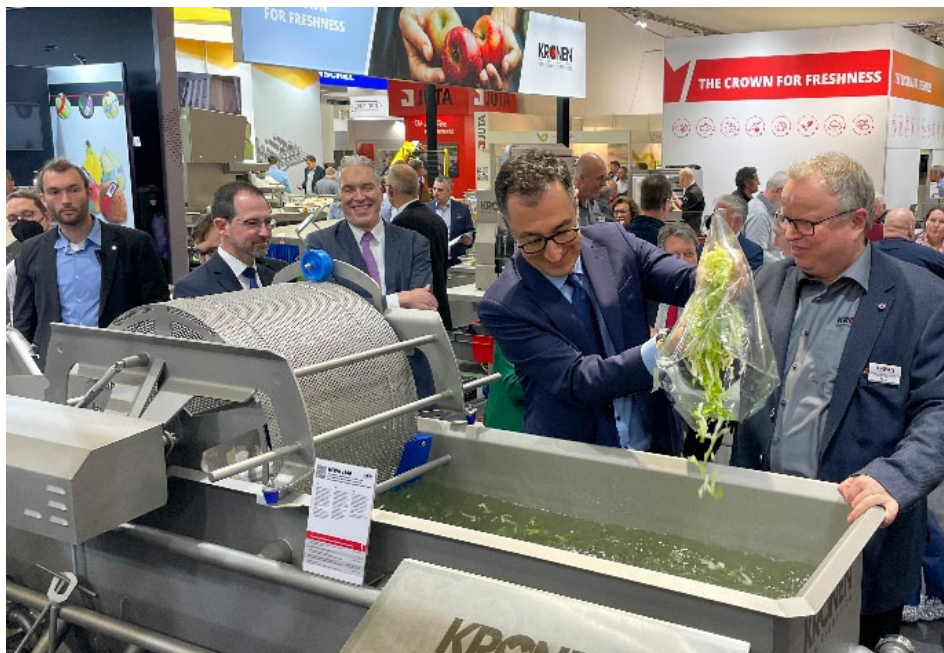
Der Bundesminister für Ernährung und Landwirtschaft, Cem Özdemir, wusch am ersten Messetag der Fruit Logistica 2023 eigenhändig Salat in der neu entwickelten KRONEN-Waschmaschine HEWA3800. Die Messe war, was die Besucherzahl am Stand betraf, nahezu auf Vor-Pandemie-Niveau.