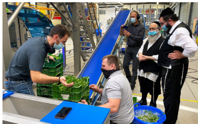
Es wurden Tests mit allen vier Produkten Grünkohl, Spinat, Rucola und Romanasalat, die beim Kunden verarbeitet werden durchgeführt.

(Wir behalten uns das Recht vor, über die Veröffentlichung von Artikeln zu entscheiden ggfs. zu bearbeiten)