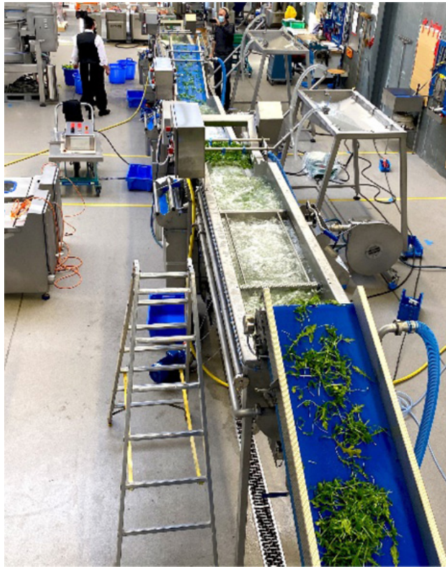
Die Waschmaschinen sind speziell an die Herstellung koscherer Lebensmittel angepasst.

eine GS 10-2 Bandschneidemaschine mit Bandverlängerung, kombiniert mit einem 4-Personen-Putzstisch, zwei KS-100 PLUS Gemüse- und Salatschleudern sowie eine UP 350 Servo Verpackungsmaschine mit 14-Kopf-Waage inkl. Zuführband, Plattform, Ausfuhrband und Drehtisch.